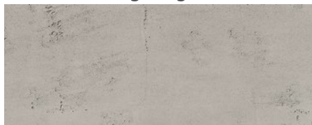
120 imi-beton glatt grau